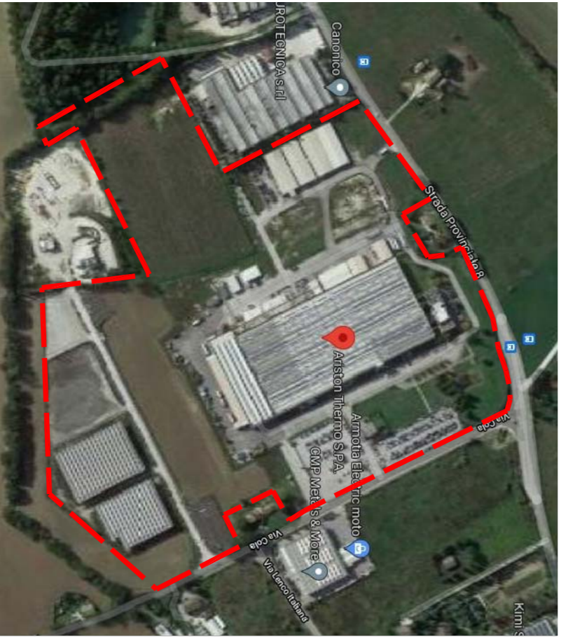
TAVOLA N°: 04 VAR SCALA: 1:1.000 DATA: OTTOBRE 2021 ADOZIONE ATTO: C.C.n. del _____ APPROVAZIONE ATTO: C.C.n. del _____