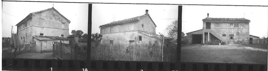
1 1A 2 2A 3 3A