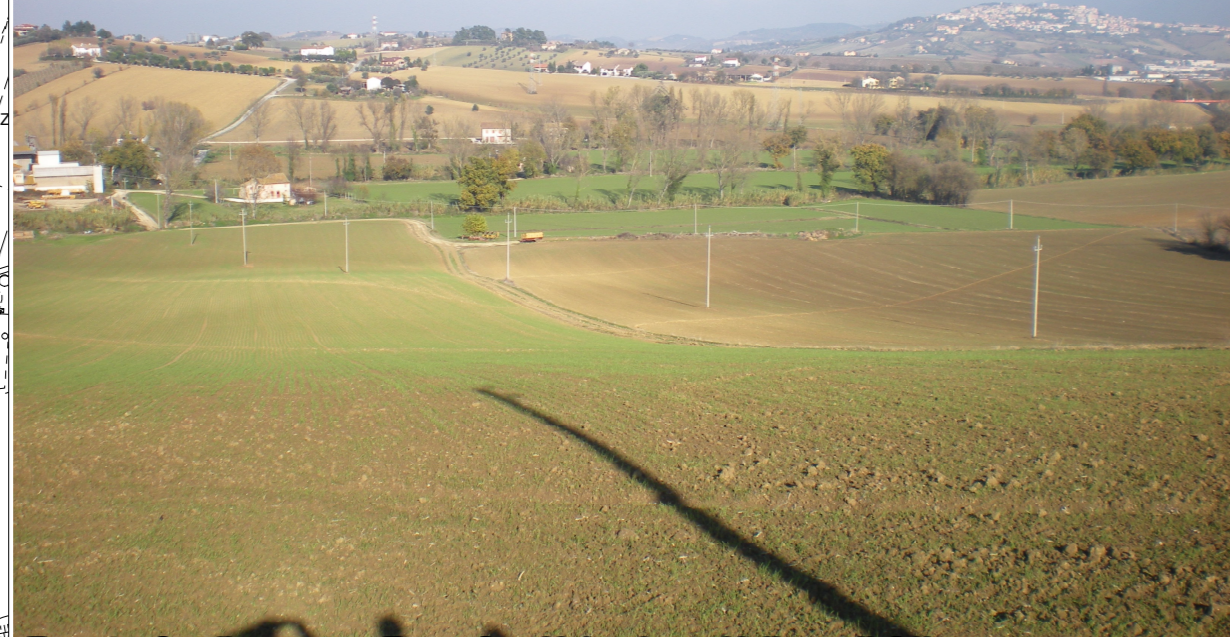
Foto 3 - Confluenza tra F.osso San Valentino e Vallone di Offagna