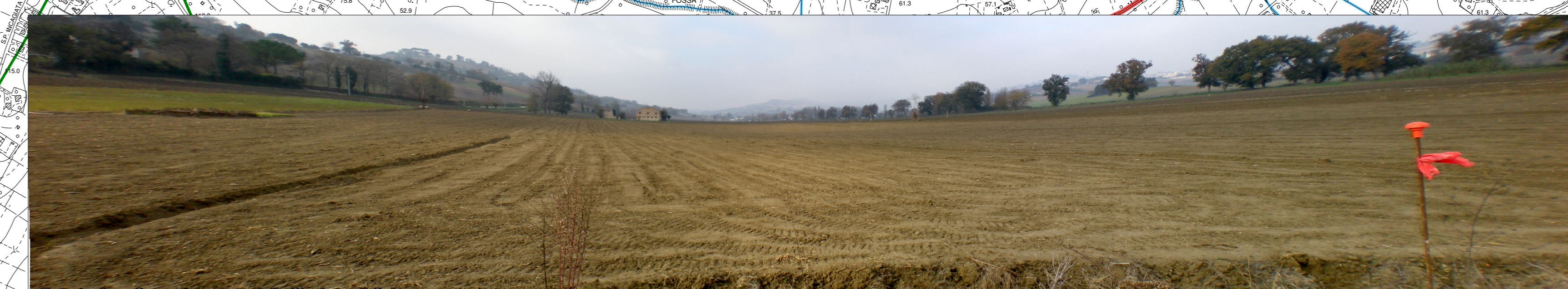
Foto 1 - Area Cassa 4 a monte della Stazione di Osimo