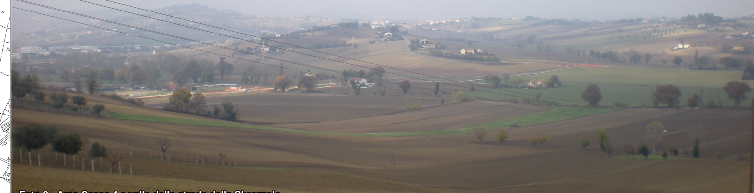
Foto 2 - Area Cassa 4 a valle della strada della Sbrozzeria